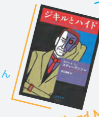
"Dr. Jekyll and Mr. Hyde"