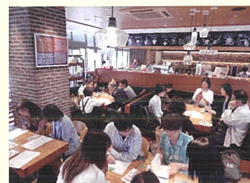
過去のブック・カフェの様子