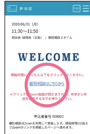
スワイプ後の画面